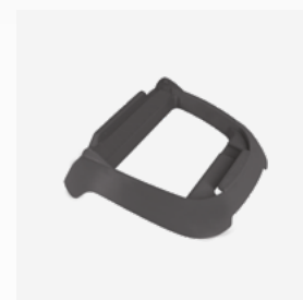
Sockel für die Steuerbox