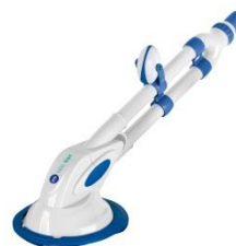
Limpiafondos automático Automatic cleaner 90399