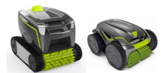
Robot Robot GT3220/GV3420