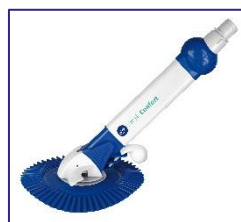
Automatischer Bodenreiniger Automatic cleaner