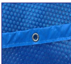
CVKPCO41 Isothermabdeckplane Isothermic cover